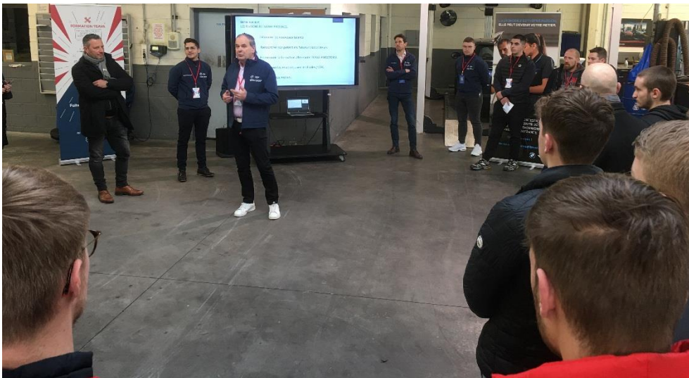
Plénière de début de journée, présentation du programme