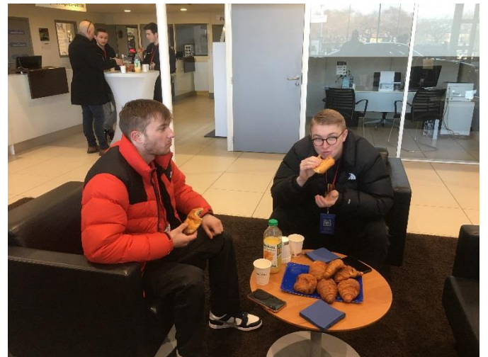
Petit déjeuner, rencontre des autres équipes.