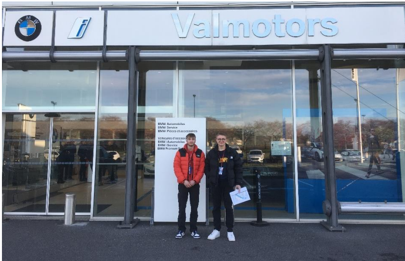
Arrivée à 8h à la concession